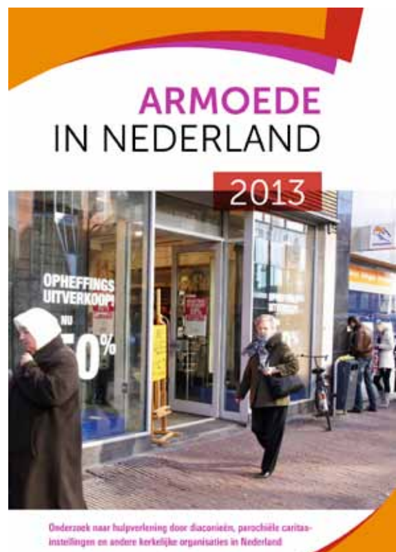
Onderzoek naar hulpverlening door diaconieën, parochiële caritasinstellingen en andere kerkelijke organisaties in Nederland

De inzet van diakenen, vrijwilligers en bestuurders bij de diaconale organisaties bedraagt gemiddeld 10 uur per aanvraag. De eerste meting van vrijwillige inzet vanuit diaconale organisaties in het kader van armoedebestrijding laat zien dat kerken een intensieve bijdrage leveren: 16.037 mensen verlenen 403.690 uren (146 per diaconale instelling) aan individuele hulp. In totaal 26.469 mensen zijn actief met collectieve ondersteuning (399 uren per diaconale instelling) ofwel 1.375.212 uren. In totaal gaat het dan om 1.778.902 uren. Dat is te vergelijken met de inzet van 950 fulltime beroepskrachten. Gerekend met een ervaren MBO professional met een bruto uurloon inclusief werkgeverslasten van 30 euro gaat het dan om 53.398.060 euro.