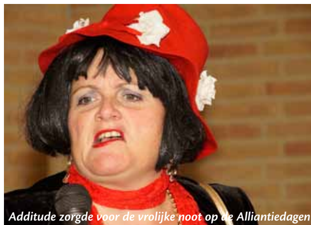
Additude zorgde voor de vrolijke noot op de Alliantiedagen

De Alliantiedagen van 2013 met het motto 'Groeien in kracht' zijn gehouden op vrijdag 4 oktober voor de regio Oost in Zutphen (80 personen), op vrijdag 11 oktober voor de regio Zuidwest in Rotterdam (100 personen), op donderdag 17 oktober voor de regio Noord in Beilen (60 personen), op vrijdag 25 oktober voor de regio Zuidoost in Roermond (180 personen) en op vrijdag 1 november voor de regio Noordwest in te Amsterdam Sloterdijk (50 personen). De workshop armoedebestrijding en noodfondsen van de kerken wordt goed bezocht. Bij de mensen die mensen in nood ondersteunen leeft het thema noodfondsen heel intensief. Op de website van o.a. de Alliantie zijn inleidingen, powerpoints en samenvattende verslagen van de workshops gepubliceerd.