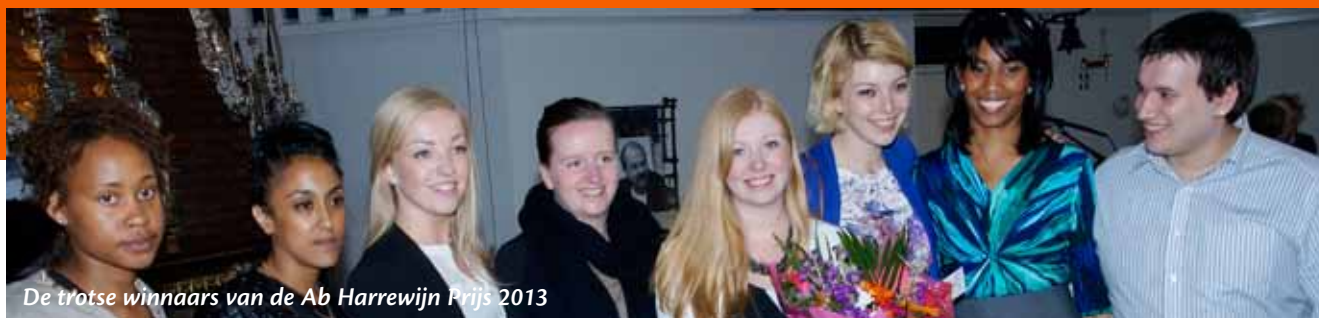
De trotse winnaars van de Ab Harrewijn Prijs 2013