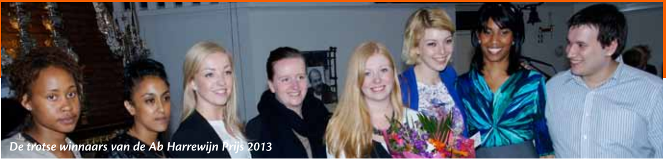
De trotse winnaars van de Ab Harrewijn Prijs 2013